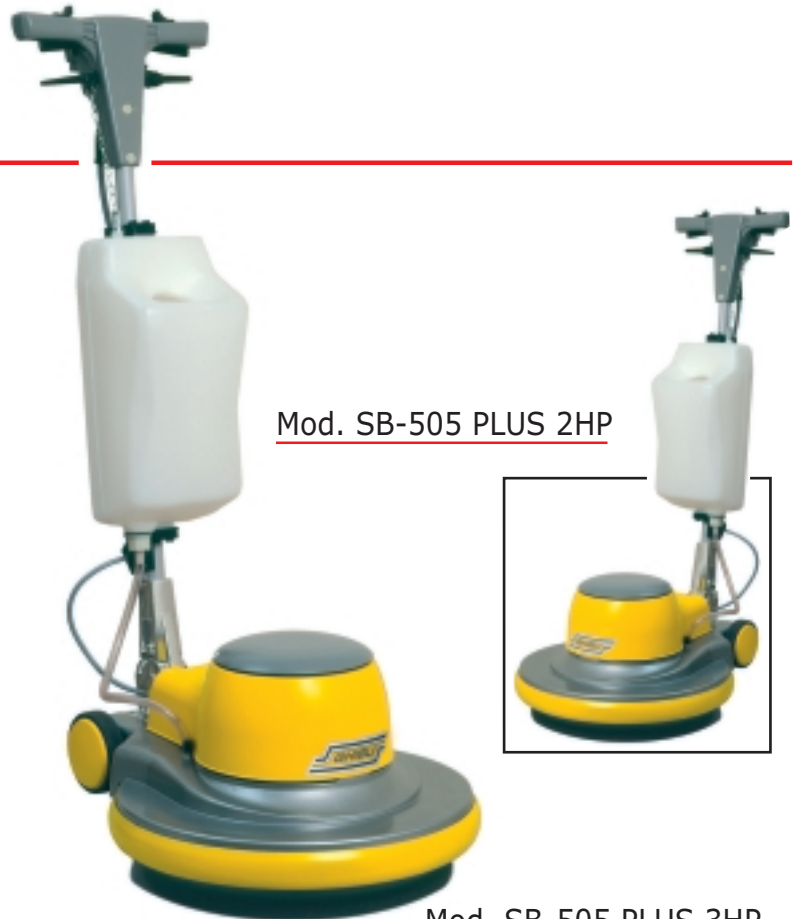
Mod. SB-505 PLUS 2HP